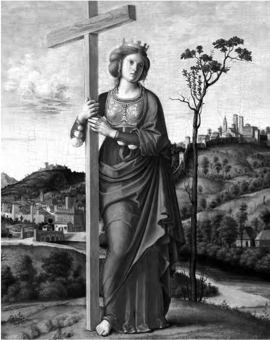
Święta Helena na obrazie Cimy da Conegliano, XV wiek.

w Jerozolimie został odnotowany już we wcześniejszych przekazach, to właśnie powyższa wersja zaczęła funkcjonować w świadomości chrześcijan jako moralna podbudowa ich religijności. Umieszczony w jerozolimskiej bazylice Prawdziwy Krzyż, symbol męki Pańskiej,